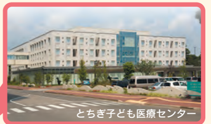
とちぎ子ども医療センター